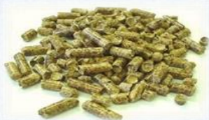
木質ペレット：おが粉などを 圧縮成型して作る固形燃料