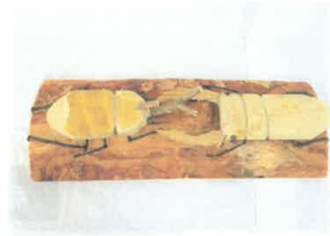
「カブトムシ VS クワガタ」 いわき市立泉小学校 1年 舟山 凜太郎